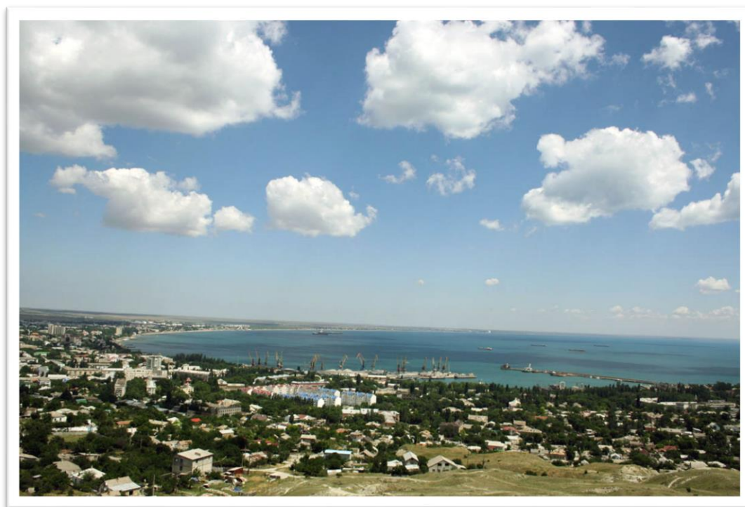
Рис.1.1. Феодосийский залив

Основным связующим путем между античными центрами, которые обычно находились на побережьях, является море. Географическое положение Феодосии удивительно удобно для жизни. Город расположен на стыке засушливых степей и равнин, богатых источниками пресной воды. Вполне объяснимо появление переселенцев из Милета в VI в. до н. э. на берегу обширного залива.