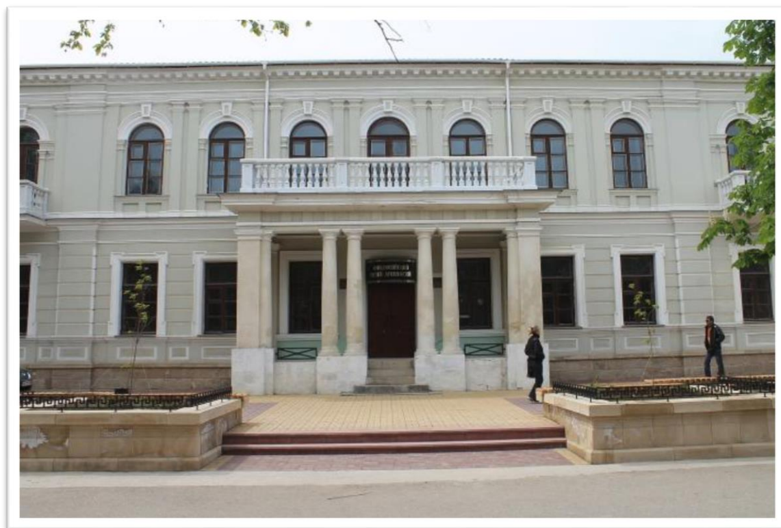
Феодосийский музей Древностей