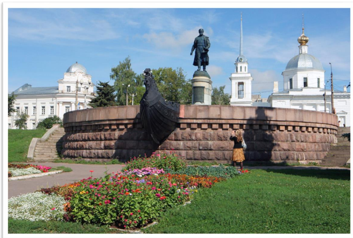
Памятник А.Никитину в Твери