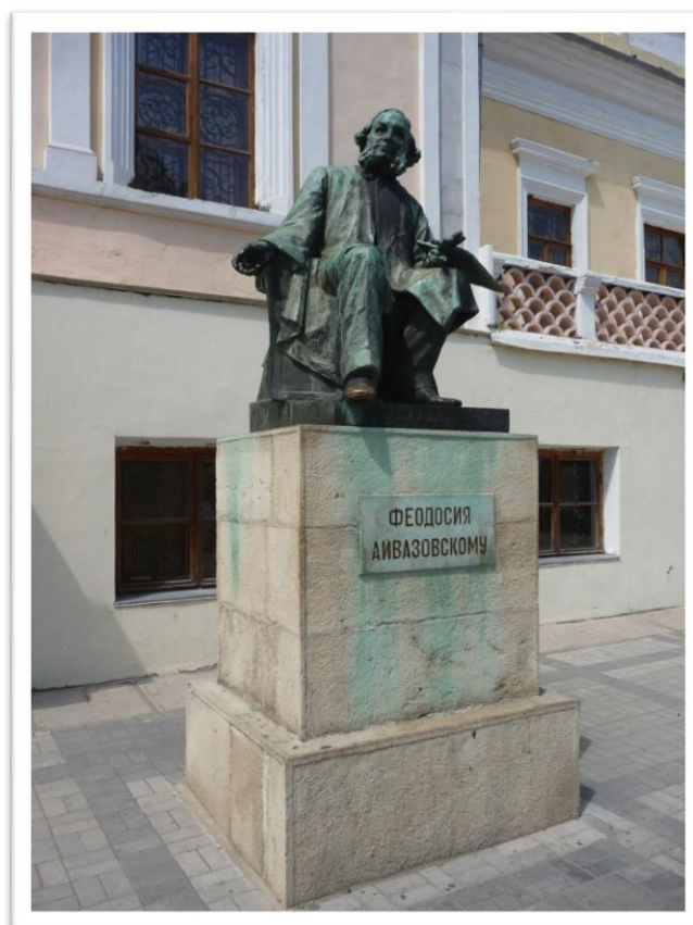
Памятник И.К. Айвазовскому