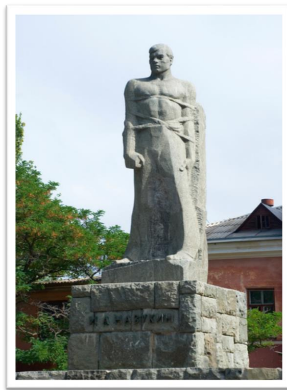
Памятник И.А. Назукину