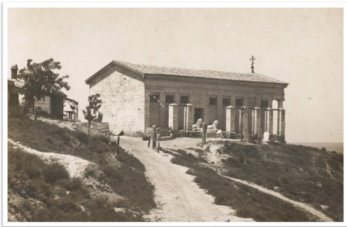
Музей Древностей на холме Митридат