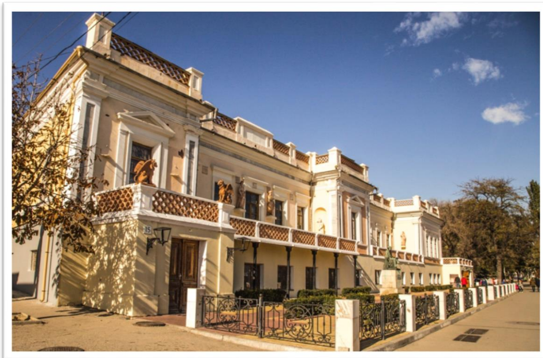
Дом И.К. Айвазовского