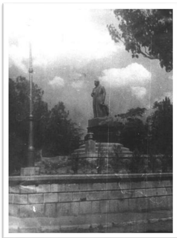
Памятник И.В. Сталину