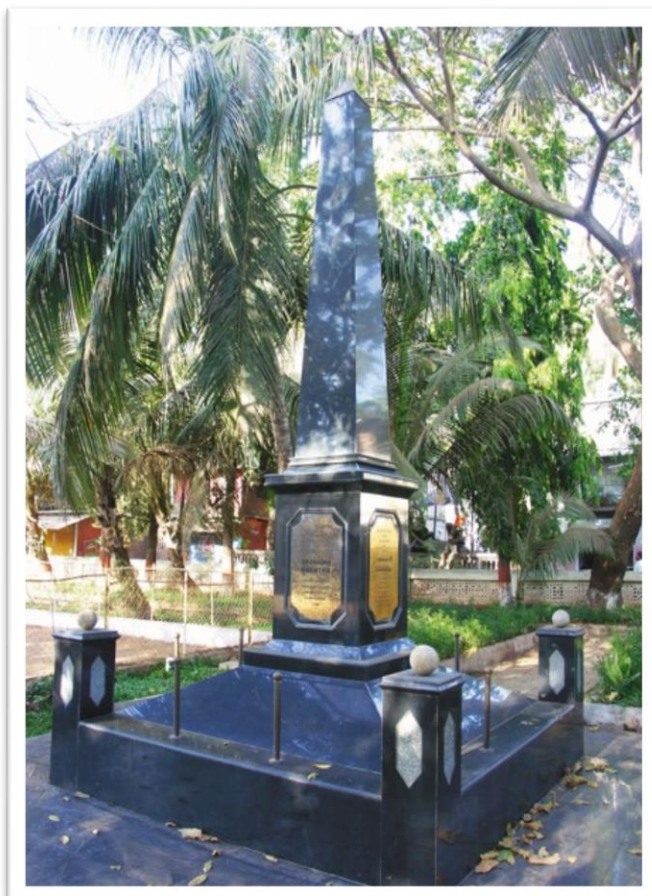
Памятник А.Никитину в Индии