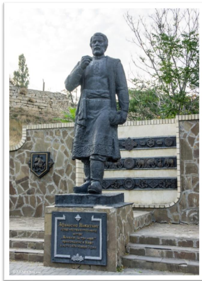
Памятник А.Никитину в Феодосии