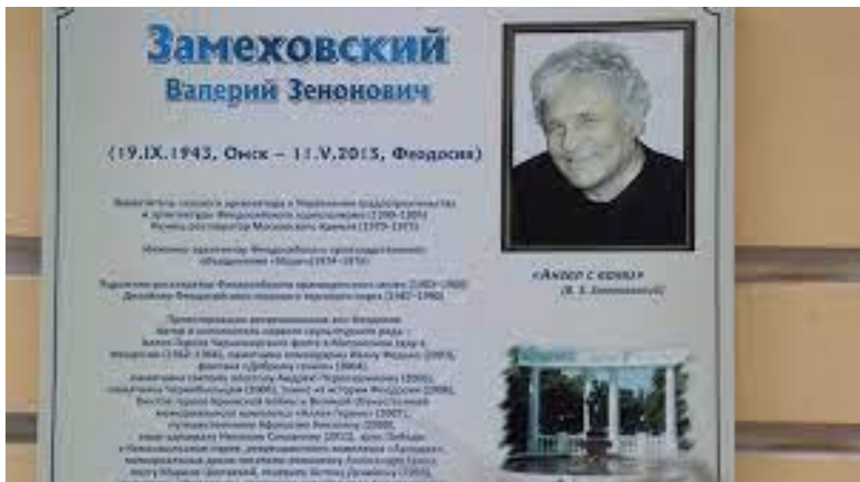
Рис. 1 Памятная табличка.

В городе Феодосии есть очень красивая, но маленькая площадь. Называется - Музейная площадь. Украшением является современный фонтан влюбленной пары, где парень и девушка стоят под зонтом. На одном из зданий этой площади висит невзрачная маленькая табличка, посвященная местному скульптору Валерию Замеховскому (рис. 1).