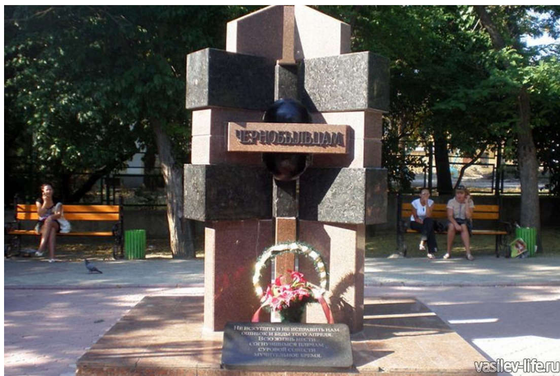
Р ис. 12. Памят ный знак «Же ртва м Чер ноб

аварии. Им в Феодосии в сквере напротив кинотеатра «Украина» установлен памятник. Открытие памятного знака жертвам Чернобыля (рис. 12) состоялось осенью 2006 года. Это уже второй памятный знак чернобыльцам в Феодосии. Первый стоял в сквере возле Казанского собора и был демонтирован, а его место заняла скульптура Андрея Первозванного.