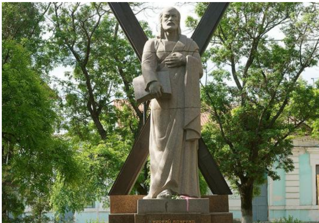
Рис. 11. Памятник апостолу Андрею Первозванному.

Скульптор Замеховский изобразил Святого Андрея (рис. 11) держащим в одной руке Евангелие, вторую приложил к сердцу. Его открытие прошло с поддержкой и вниманием многих горожан, властей и, что примечательно, представителей других религий.