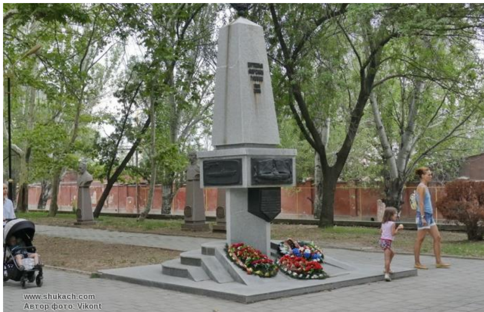
Рис. 8. Памятник-стела «Витязям морских глубин».

активно принимая в это время участие в испытаниях боевого вооружения и техники. Автором Валерием Зеновичем в облике передана дань уважения погибшим морякам.