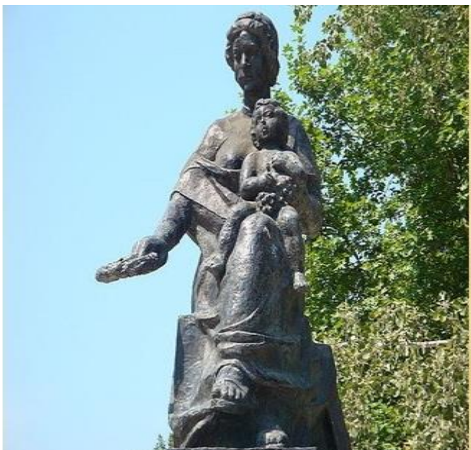
Рис. 7. Памятник Матерям города.

В том же году в сквере на улице Володарской мастер Валерий Замеховский изваял любимым женщинам памятник - Матерям города. Это дань признания, уважения и любви к матерям, которые заботятся, воспитывают, поддерживают и вдохновляют своих детей в любом возрасте. Феодосийцы благодарят и воздают должное бескорыстному и самоотверженному материнскому труду. Это памятник объединяет всех и подчеркивает особую роль женщин в жизни общества (рис. 7).