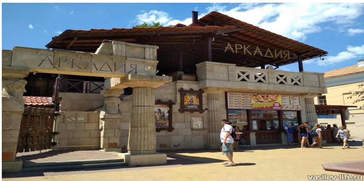
Рис. 15. Рекреационный комплекс «Аркадия».