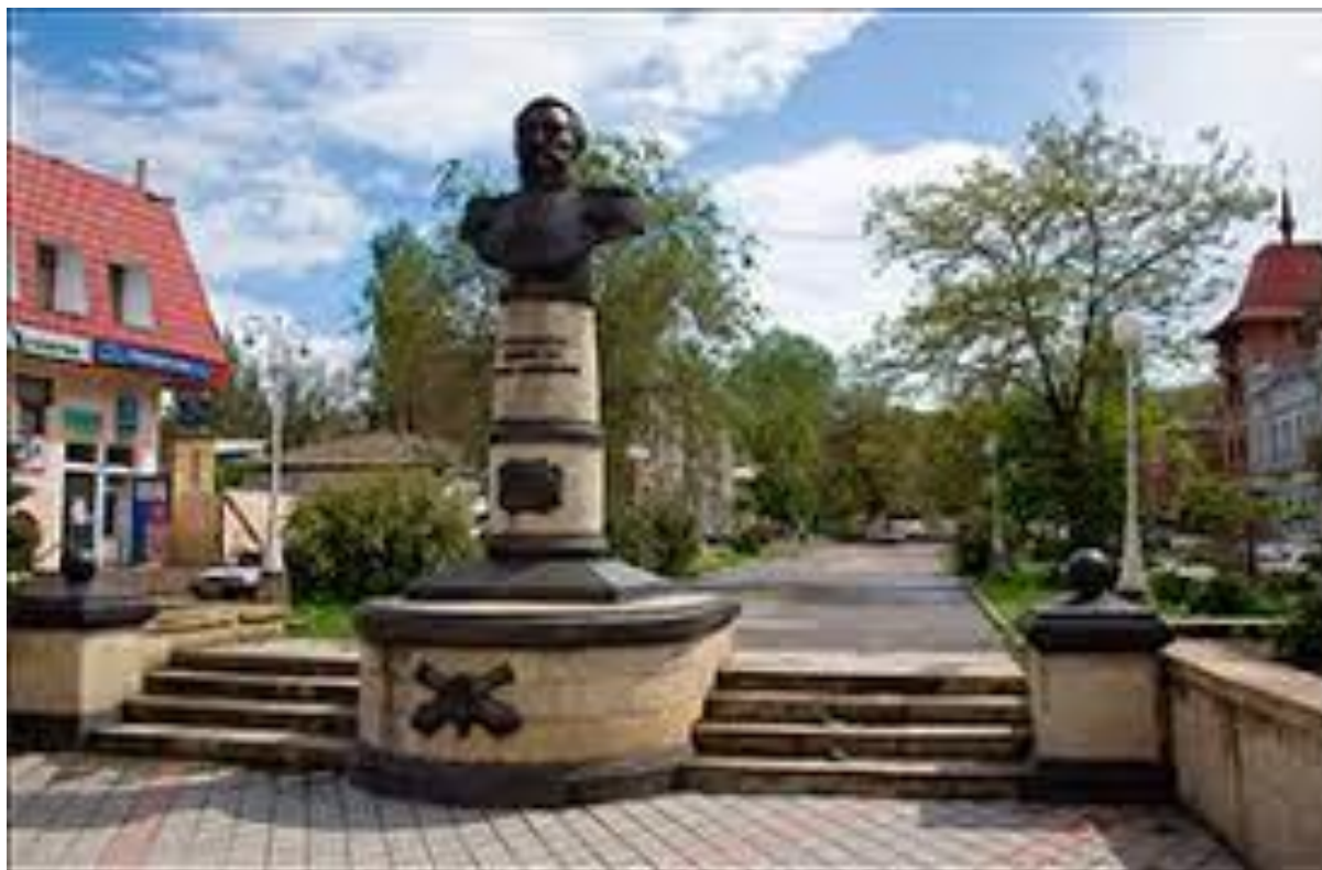
Рис. 3. Памятник Н. М. Соковнину

В Комсомольском парке стоит памятник – бюст из чугуна Ивану Федько (рис.4).